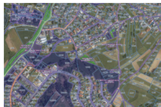
slika 2: Koridor izgradnje dela južne povezovalne ceste

Glede zasipavanja vrtač je bil v imenu krajanov naše KS na Mestno občino Novo mesto, v mesecu avgustu poslan dopis, v katerem smo pristojne seznanili s problematiko povečanega tovrnega prometa. V nadaljevanju se je na usklajevanih sestankih dosegel sporazum z investitorji, da prispevajo k saniranju poškodb cestišča. V mesecu novembru so se po pregledu in oceni škode na cestišču že izvedle delne preplastitve cestišča.