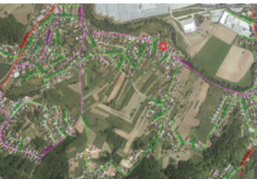
slika 1: Prometno omrežje KS Regrča vas

Ugotovljeno je bilo, da se preobremenitev obstoječega cestnega omrežja znotraj KS pojavlja zaradi povečanega prometa na lokalni zbirni cesti Šmihel – Regrča vas – Gotna vas, ki predstavlja najkrajšo povezavo in najhitrejšo pot iz JV na JZ stran Novega mesta in obratno. Dodatno se je povečal tudi težak tovorni promet zaradi poselitve ulice K Roku oz. delu naselja Sv. Rok za potrebe novogradnje stanovaljskih hiš in intenzivnega zasipavanja naravnih vrtač na Sv. Roku.