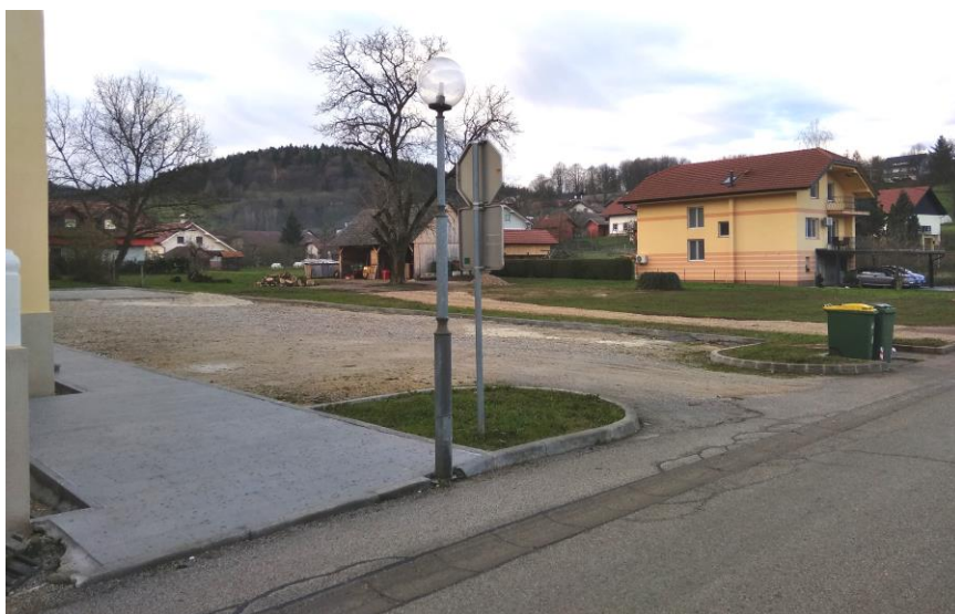
Območje »D« - Parkirne površine ob cerkvi sv. Križa