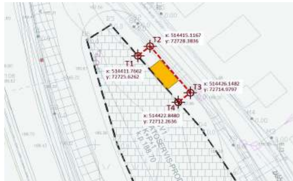
Prikaz načrtovanega prizidka na izseku iz veljavnega zazidalnega načrta ter prikaz koordinat, ki določajo območje odstopanja od dovoljene gradbene linije (črno črtkano)