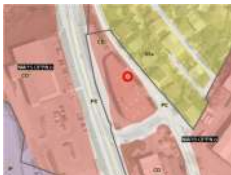
Slika 1: Izsek iz veljavnega OPN MONM

Mestna občina Novo mesto vodi postopek priprave sprememb in dopolnitev Zazidalnega načrta za poslovno oskrbni center ob Belokranjski cesti v Novem mestu z Id. št. 1573 (v nadaljevanju: SD ZN). SD ZN se pripravlja na podlagi Zakona o urejanju prostora - ZUreP-2 (Uradni list RS, št. 61/17). Pobudnik priprave SD ZN je Panvita, Mesna industrija Radgona d.d., Ljutomerska cesta 28, 9250 Gornja Radgona, izdelovalec pa podjetje ACER Novo mesto d. o. o.