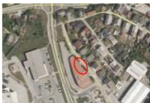
Slika 2: Prikaz območja predvidene pozidave