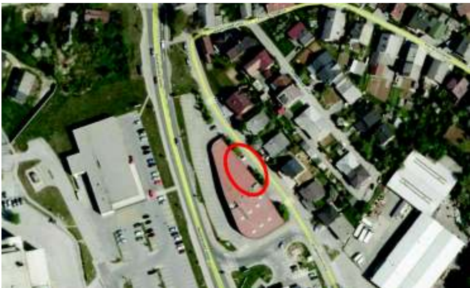
Prikaz območja predvidene dozidave na zračnem posnetku