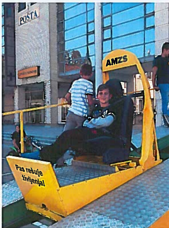
Slike 74 - 79: živahno dogajanje na Novem trgu ob Dnevu brez avtomobila