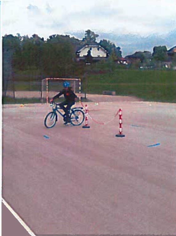
Slike 11-14: terenska vožnja, poligon in komisija na delu