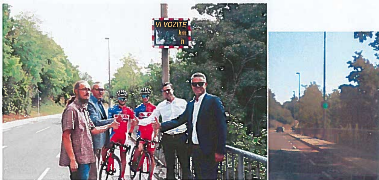
Slika 21 in 22: postavitve radarske table MHP 50 na Seidlovi cesti

Mestna občina Novo mesto / SPV Novo mesto je podal prijavo na dveh razpisih za sofinanciranje nakupa radarskega prikazovalnika hitrosti – tabla Vi vozite. Na razpisu smo bili uspešni, obenem pa smo pridobili tudi sofinanciranje za nakup drugega prikazovalnika Sipronika MHP 50 na Seidlovi cesti s strani AMZS. Oba prikazovalnika sta povezana na spletni portal Vi Vozite.