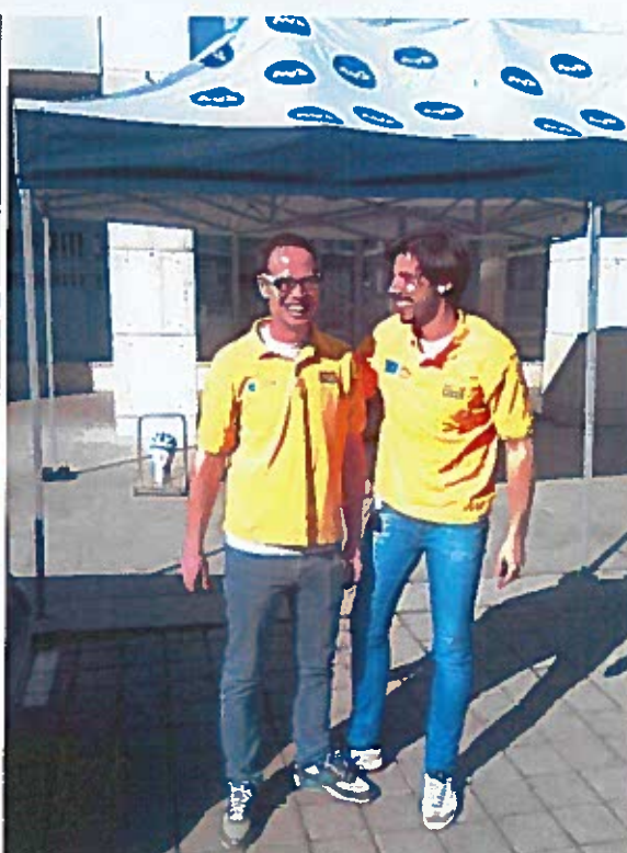
Slike 7-9: izvedba aktivnosti v akciji Alkohol