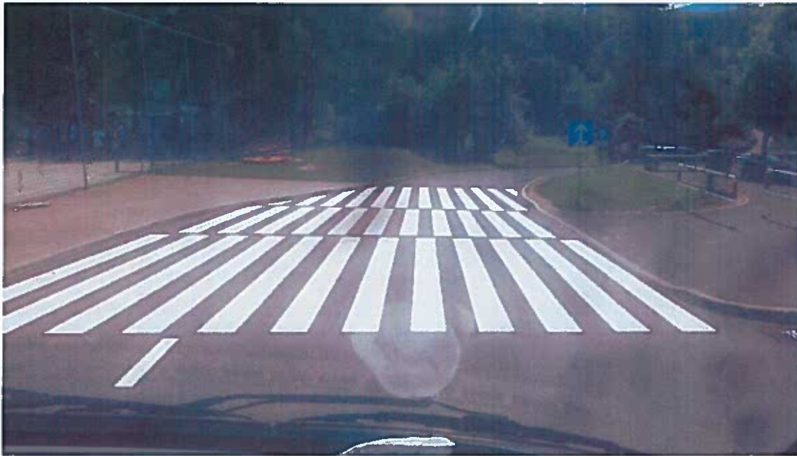
Slika 47: : izvedena dela na prehodu za pešce pri OŠ Stopiče