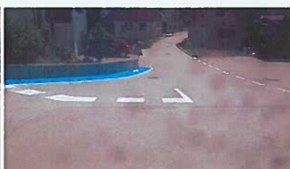
Slike 34 - 46: izvedena dela na prehodih za pešce, nivojskih peščevih površinah