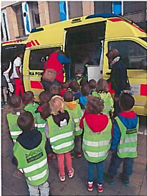
Slike 68 - 73: živahno dogajanje na Novem trgu ob Dnevu brez avtomobila