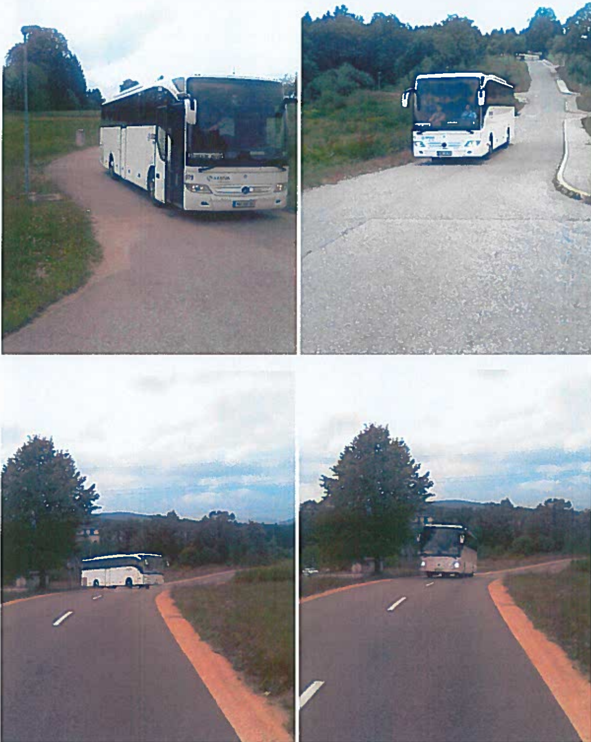
Slike 30 - 33: preveritev prevoznosti – ulica Na Hribu