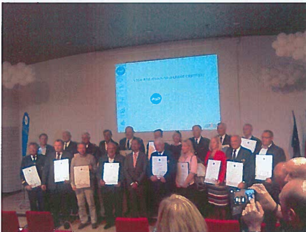
Slika 10: podelitev svečane listine AVP, oktober 2017

Svečana listina se podeljuje na podlagi razpisa. Razpis za javni poziv pripravi vsako leto Svet AVP in je javno objavljen na spletnih straneh AVP, na katerega predlagatelji podajo svoje predloge. Komisija za priznanja obravnava predloge. Svet AVP obravnava predlog komisije za priznanja ter imenuje prejemnike. Priznanja Svečana listina se podeljuje enkrat letno na posebni svečanosti, ki jo organizira AVP.