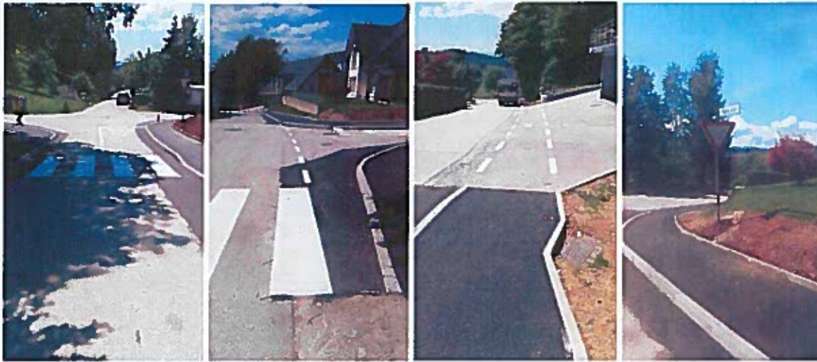
Slike 63 - 66: po izvedbi del – urejen pločnik, prehodi za pešce in križišče s Skalno ulico