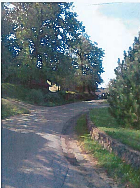
Slike 26 - 29: delo komisije – Vrh pri Ljubnu