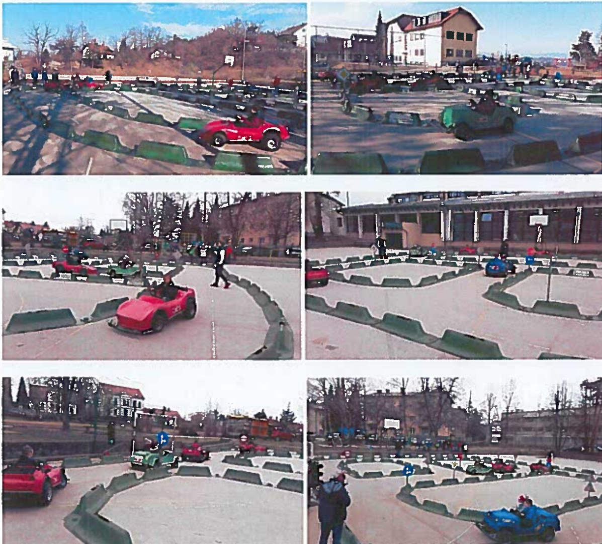
Slike 1-6: izvedba programa Jumicar

Jumicar otrokom na zabaven a poučen način, preko igre predstavi pravilno vedenje v prometnem okolju, tako, da bodo postali bolj previdni in vestni udeleženci v prometu. Postavljeni so v vlogo voznika in doživljajo dogodke, kot jih opaža voznik v pravem prometu. Posredovano je vse potrebno znanje o prometu, ki ga mladi udeleženci potrebujejo. Obenem pa je to za otroke tudi posebna izkušnja, saj nimajo vsak dan možnosti, da se s štirikolesniki vozijo po poligonu, ki vključuje realistično simulacijo prometnega okolja s pravimi križišči, prometnimi znaki in semaforjem.