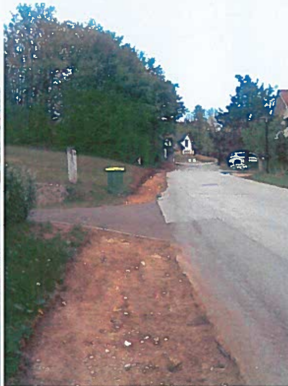
Slike 61, 62: izvajanje del (priprava terena pred tamponiranjem)