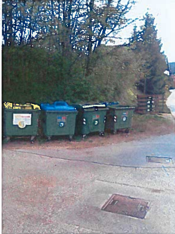
Slike 57 - 60: pred izvedbo