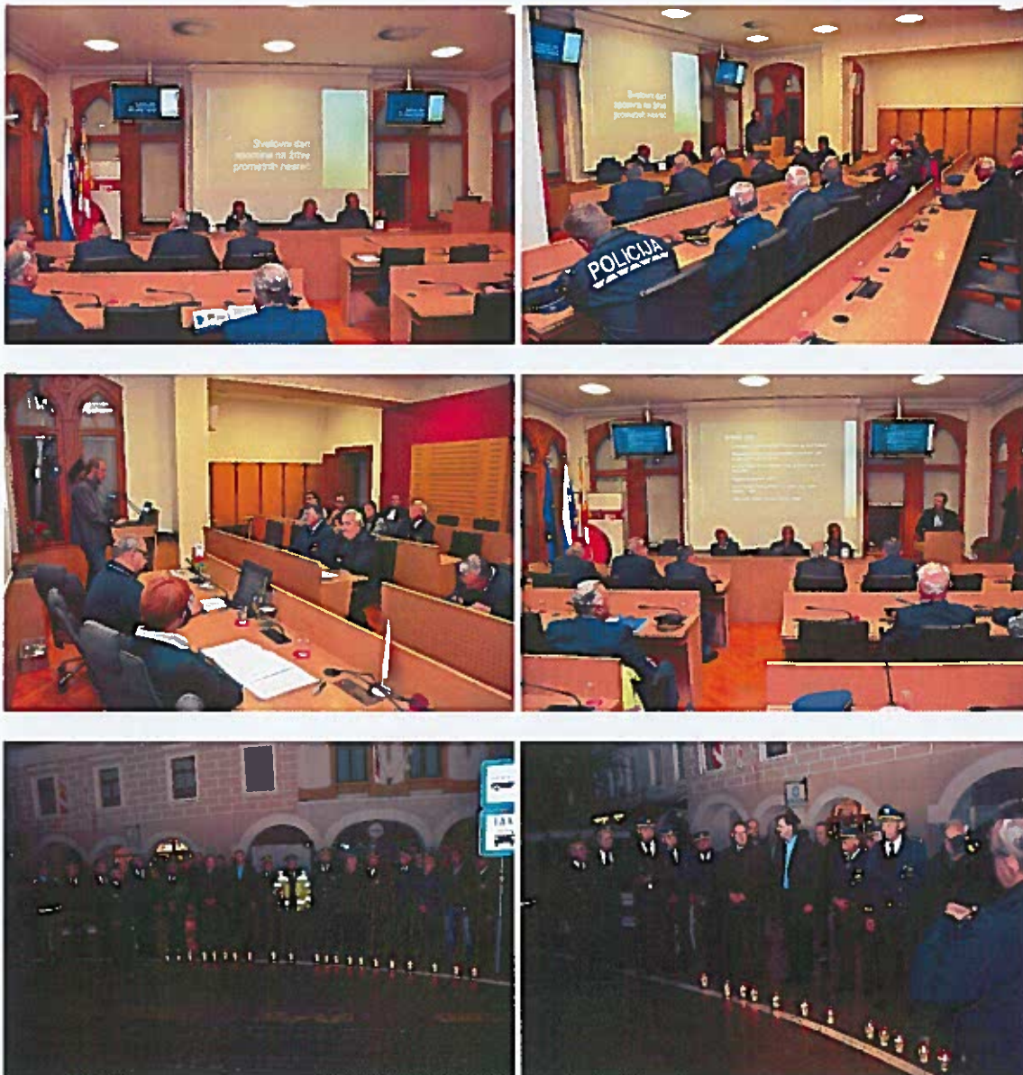
Slike 80 - 85: svečana seja in protokol prižiga svečk na Glavnem trgu

Svetovna zdravstvena organizacija je leta 2007, tretjo nedeljo v novembru, imenovala za svetovni dan spomina na žrtve prometnih nesreč. Mestna občina Novo mesto in Svet za preventivo in vzgojo v cestnem prometu sta se tudi letos pridružila aktivnosti v počastitev tega dneva in organizirala slovesnost ob Dnevu spomina na žrtve prometnih nesreč, kjer so bili prisotni podžupan MONm, predsednik SPV MONm in člani SPV MONm, predstavniki Policijske postaje in Policijske uprave Novo mesto, člani ZŠAM in drugi, ki sodelujejo pri aktivnostih SPV. Na ta način smo se priključili skupni akciji, ki je poudarila pomen ustrezne prometne kulture s ciljem, čim manj prometnih nesreč.