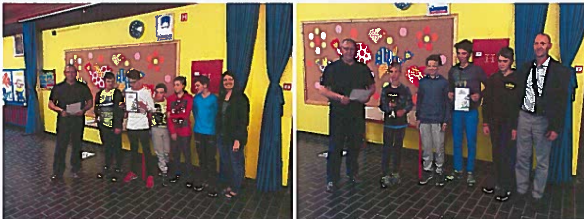
Sliki 19 in 20: ekipa OŠ Grm in ekipa OŠ Drska