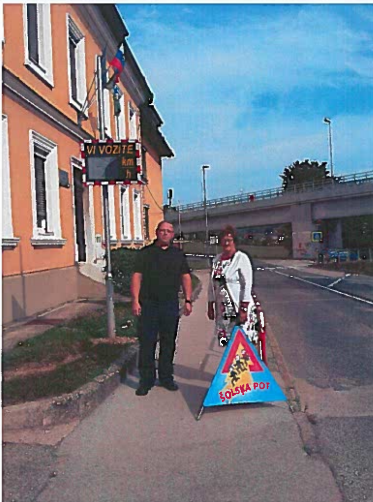
Slika 67: predaja triopana »šolska pot«