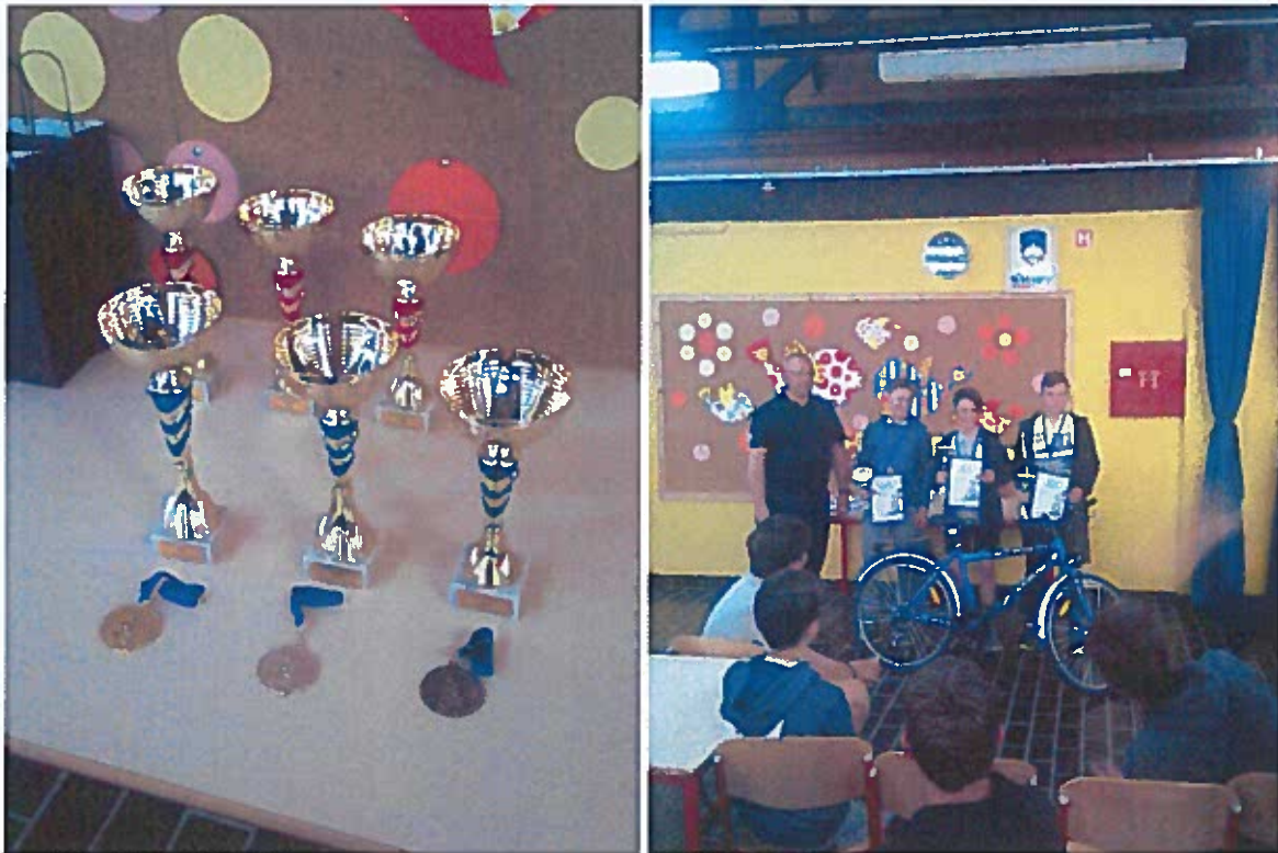
Slike 15-18 poligon, teoretični del, pokali in podelitev priznanj