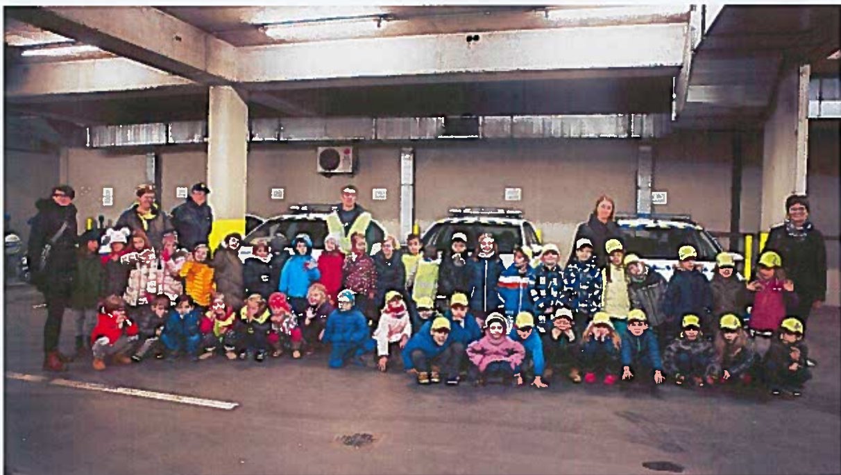
Slika 52: skupinska fotografija po ogledu policijske postaje