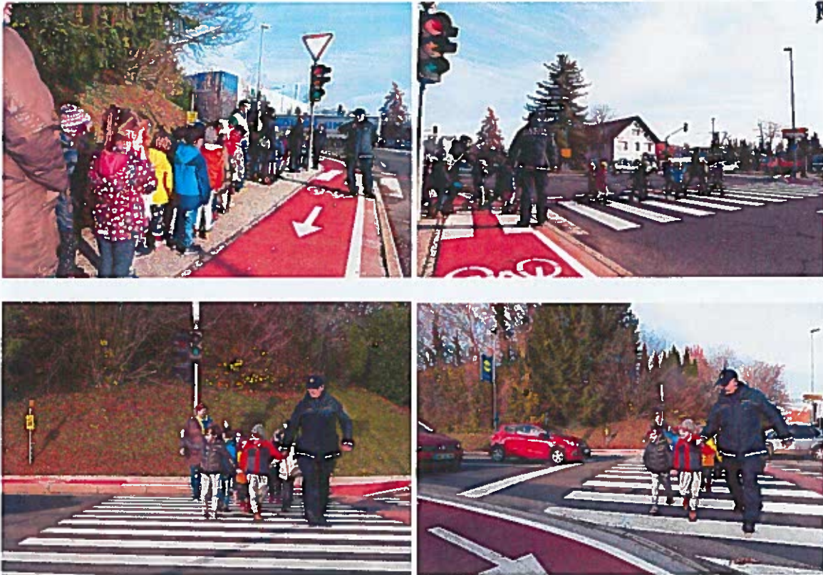
Slike 48 - 51: ogled prometnega okolja

Svet za preventivo in vzgojo v cestnem prometu