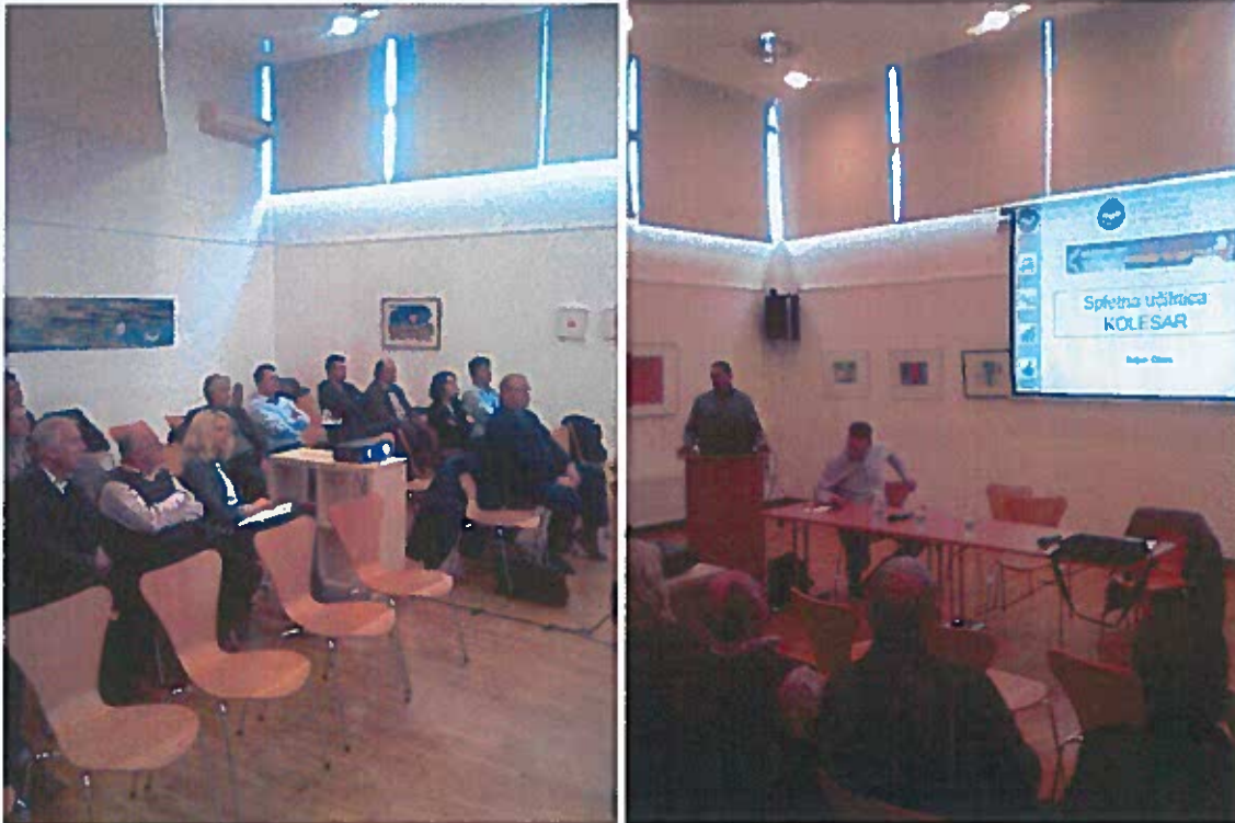
Slike 53 - 56: posvet SPVjev JV Slovenije in Spodnjeposavske regije