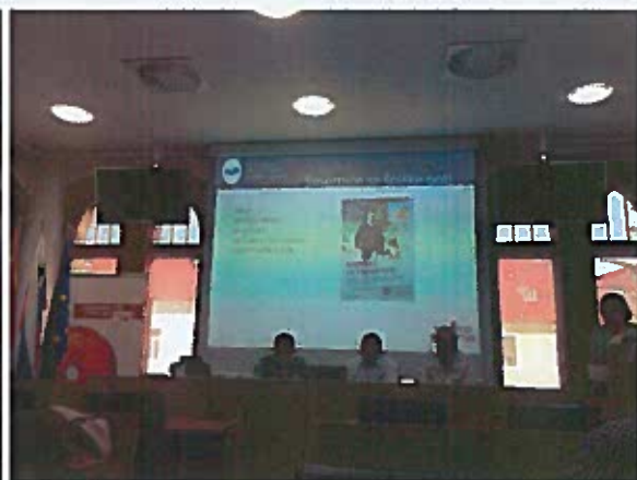
Slika 23 – 25: posvet: Prometna varnost na poti v šolo in domov, Rotovž, avgust 2017