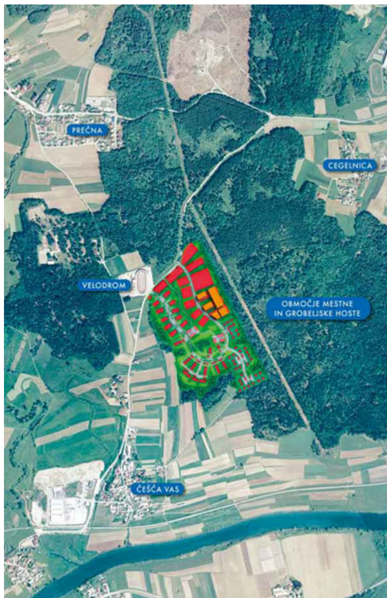
Slika: Posnetek območja opremljanja

Območje obsega parcele ali dele parcel števil: 1034, 421/5, 421/6, 1024/5, 1024/4, 421/4, 421/7, 1024/6, 420/5, 420/4 v k.o. Bršljin in 2095/10, 2095/11, 2095/12, 2095/14, 2075/73, 2075/72, 2075/76, 2075/74, 2095/18, 2094/7, 2094/14, 2094/8, 2094/20, 2094/15, 2094/10, 2094/9, 2094/6, 2094/16, 2095/5, 2095/6, 2095/7, 2098/4, 2098/3, 2095/8, 2095/9, 2094/18, 2094/19, 2094/13, 2094/12, 2094/11, 2075/93, 2095/17, 2095/13, 2075/37, 2075/34, 2075/33, 2075/75, 2075/32, 2075/30, 2075/31, 2075/77, 2075/38, 2075/39, 2075/40, 2075/22, 2072/1, 2070, 2223/3, 2066/3, 2064/1, 2064/2, 2073/3, 2073/1, 2074/1, 2074/2, 2074/3, 2074/4, 2074/5, 2074/6, 2074/7, 2075/1, 2079/1, 2080/7, 2080/1, 2080/3, 2080/5, 2075/16, 2075/17, 2075/84, 2075/83, 2075/14, 2075/85, 2075/12, 2075/86, 2075/10, 2075/87, 2075/8, 2075/88, 2075/6, 2075/89, 2075/4, 2075/82, 2223/1, 2081/1, 2084/1, 2083/5, 2075/81, 2075/80, 2086/3, 2075/79, 2087/9, 2087/1, 2075/78, 2090/1, 2091/1, 2075/5, 2075/42, 2075/69, 2075/50, 2075/49, 2075/48, 2075/47, 2075/46, 2075/45, 2075/44, 2075/43, 2075/68, 2075/70, 2075/58, 2075/57, 2075/56, 2075/55, 2075/54, 2075/53, 2075/52, 2075/51, 2075/67, 2075/71, 2075/66, 2075/65, 2075/64, 2075/63, 2075/62, 2075/61, 2075/60, 2075/59, 2075/13, 2075/23, 2075/15, 2075/18, 2075/19, 2095/19, 2075/20, 2075/35, 2075/36, 2075/25, 2075/26, 2075/27, 2075/28, 2075/29, 2095/15 in 2095/16 v k.o. Gornja Straža.