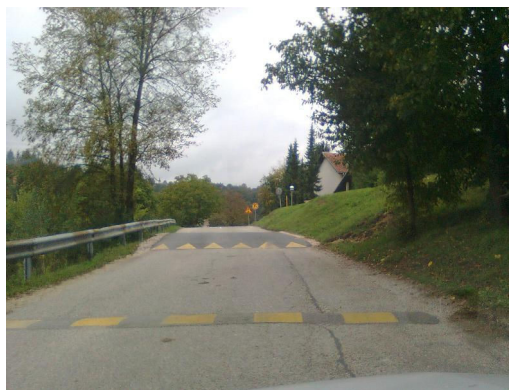
Slika: montažna grbina na Sokolski ulici in plato v Stopičah