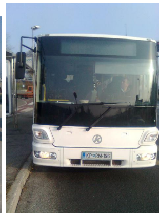
Slika: preizkus vozil Solaris in Hidra city