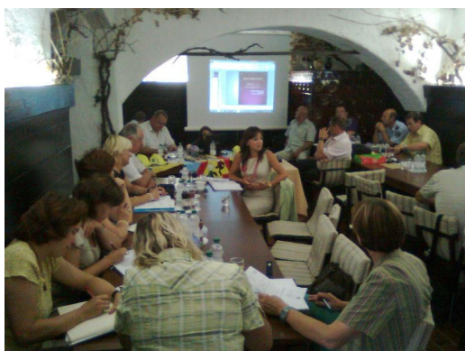
Slika: srečanje ravnateljev srednjih in osnovnih šol v zvezi z varnostjo prometa na poti v šolo oziroma iz šole

Posebno pozornost smo posvetili pripravam in izvedbi ukrepov za prvi šolski dan (akcija je trajala prvih 14 dni v mesecu septembru) in organizaciji prometnih delavnicah ne srednjih šolah na območju Mestne občine Novo mesto. Skupaj s Policijsko postajo Novo mesto in Javno agencijo Republike Slovenije za varnost prometa, Svetom za preventivo in vzgojo v cestnem prometu smo organizirali in izvedli tudi druge naloge, ki so bile planirane v letu 2011 kot so akcije: motorist (pri tej akciji so sodelovali še Gasilsko reševalni center Novo mesto, Zdravstveni dom Novo mesto, Rdeči križ Novo mesto), pasavček (Osnovni šoli Podgrad in Grm, uporaba varnostnega pasu), »BODI preVIDEN«, Evropski teden prometne varnosti, Dan spomina na žrtve prometnih nesreč ipd.