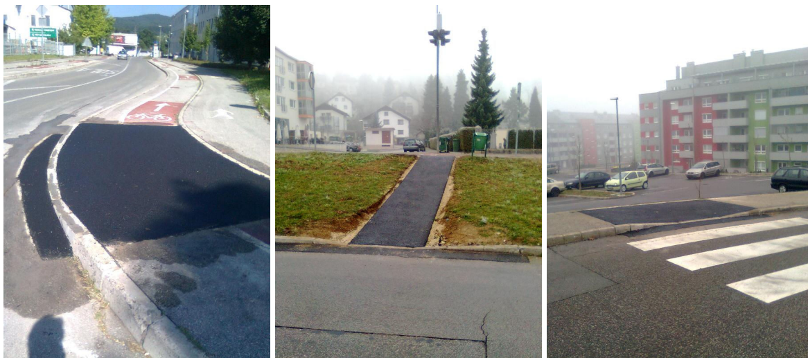
Slika: ureditev klančin v Bršljinu, na Seidlovi cesti v območju OŠ Drska

V okviru razpoložljivih sredstev smo izvedli večje število ureditev prometne infrastrukture tako, da bi s tem olajšati življenje telesno prizadetim udeležencem v prometu, ker telesna prizadetost, bodisi trajna ali prehodna, ki je povezana z omejitvami gibanja, povzroča funkcionalno oviranim ljudem veliko težav v bivalnem okolju. Na področju urejanja arhitektonskih ovir so se odpravile ovire na območju Drske, Bršljina, na Seidlovi cesti (tudi povezava do ploščadi pri stanovanjskih blokih in na ta način omogočili hendikepiranim osebam nemoteno komunikacijo z ostalimi prometnimi površinami.