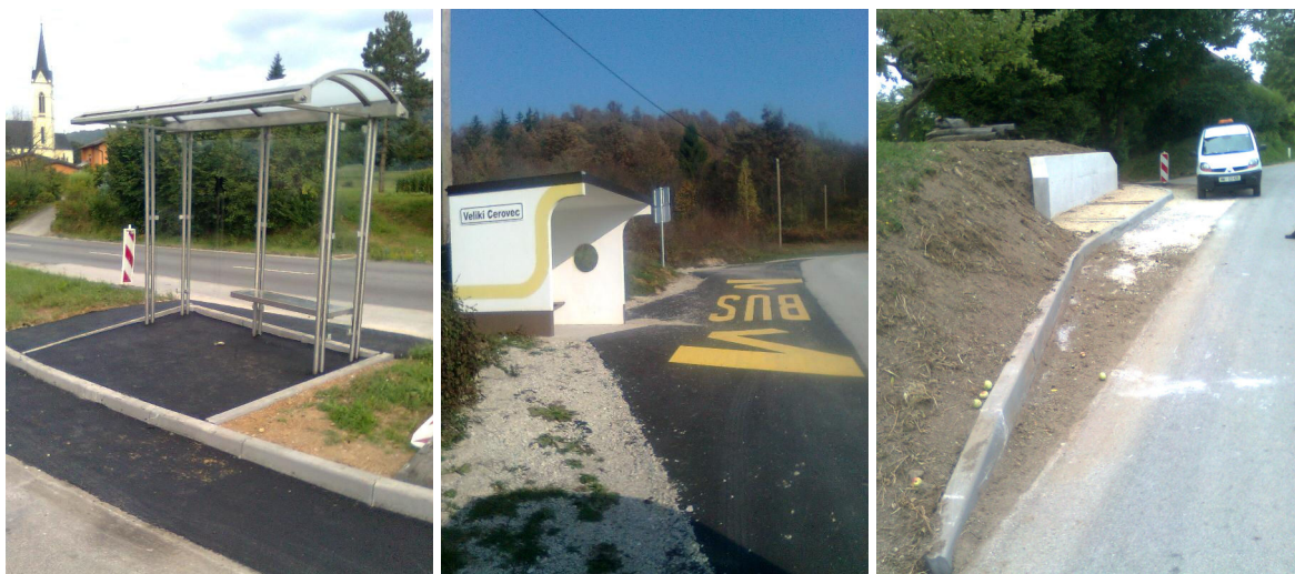
Slika: urejeno postajališče v Prečni, Velikem Cerovcu in Herinji vasi

javnih cestah (Uradni list RS, št. 110/2006) smo uskladili dvajset prometnih znakov za označitev avtobusnih postajališč, zamenjali smo nekaj klopi v zavetiščih za potnike in steklenih stranic, ki so bile zaradi vandalizma razbite. Ob občinskih cestah po katerih potekajo linije mestnega potniškega prometa je še veliko avtobusnih postajališč, ki se nahajajo na vozišču cest. Obveza Mestne občine je, da se le ta uredijo izven vozišč cest in se na ta način poveča varnost v prometu. Letos smo za potrebe prevoza šolskih otrok uredili avtobusno stajališče v Velikem Cerovcu (stajališče za potnike z zavetiščem), asfaltiranje in označitev postajališča s talno in vertikalno prometno signalizacijo, avtobusno postajališče v Prečni (opremili z zavetiščem, delno popravili asfalt in uredili dostop, ter obnovili prometno signalizacijo), z zavetiščem smo opremili postajališče na Pahi in celovito uredili postajališče v Herinji vasi (izgradnja opornega zidu, asfaltiranje, postavitve zavetišča in označitev). V mestu smo v okviru rekonstrukcije Šmihelske in Ljubljanske ceste celovito opremili skupaj štiri avtobusna postajališča (zavetišče za potnike s pripadajočo opremo, talna in vertikalna prometna signalizacija ter vgradnja city light panojev).