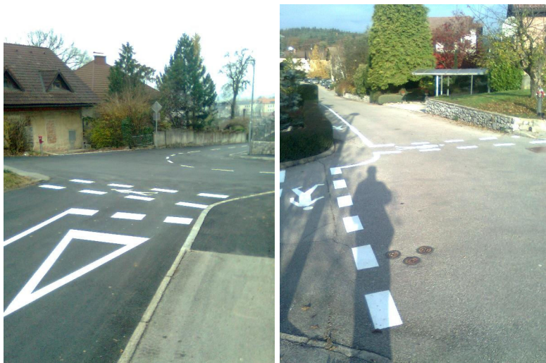
Slika: ureditev prehoda za pešce na Koštialovi ulici in ulici Pod Trško goro, kjer smo uredili tudi površino za pešce