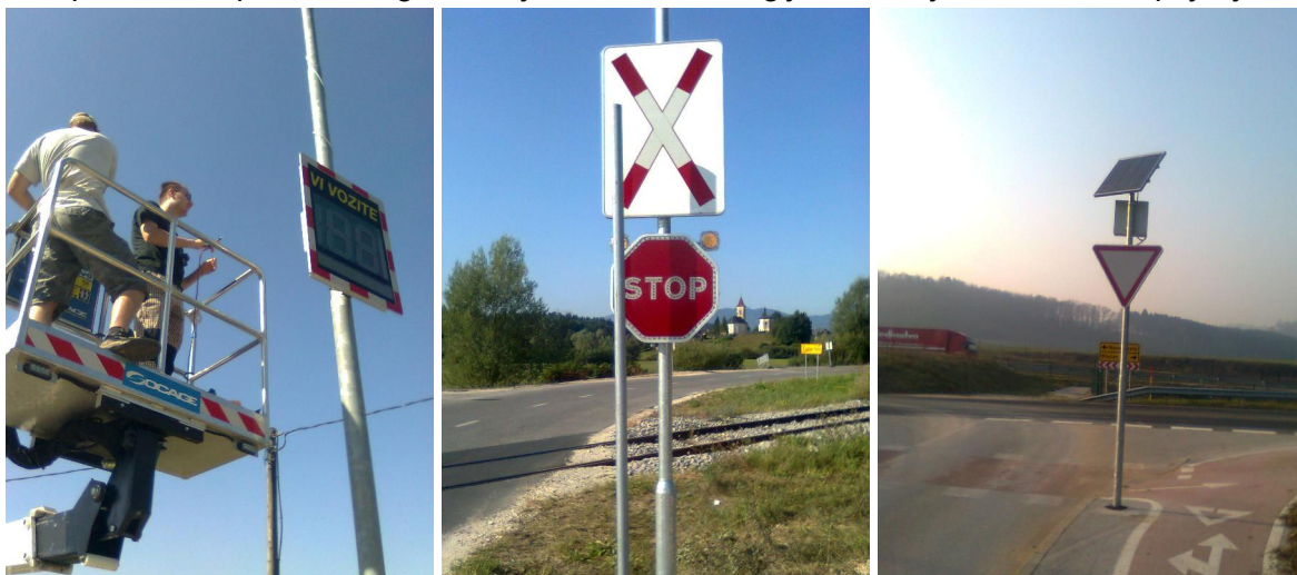
Slika: preizkus naprav za meritve v prometu (slovenski proizvajalec), dobava in montaža svetlobnih prometnih znakov na železniškem prehodu v Češči vasi in križišču pri Lešnici

Vsa prometna oprema in signalizacija z LED tehnologijo ima urejeno solarno napajanje.