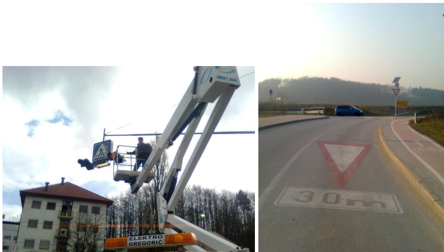
Slika: Zamenjava dotrajanega biča na prehodu za pešce v Bršljinu, talna in vertikalna signalizacija v križišču pri Lešnici