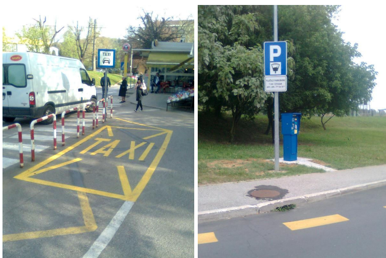
Slika: urejeno avtotaksi postajališče, parkomat v Portovalu

Sredstva so bila porabljena za vzdrževanje in urejanje javnih parkirnih prostorov na območju ožjega in širšega mestnega jedra in urejanju parkirnih prostorov za dostavna vozila. Sredstva so porabljena tudi za tiskanje raznih dovolilnic, ki jih je po odloku dolžna pripraviti in izdajati občinska uprava (dovolilnice za gospodinjstva in tovorna vozila za dostop v staro mestno jedro, dovolilnice za invalide in dovolilnice za upravne organe). Uredili smo tudi način parkiranja avtobusov na območju Portovala z uvedbo plačljivega režima in postavitevijo parkomata. V zvezi z urejanjem mirujočega prometa na območju ožjega mestnega središča so bile izvedene nekatere izboljšave na parkirnih prostorih s katerimi smo omogočili nemoteno hojo pešcev na Glavnem trgu (zamenjava poškodovanih elementov), obenem smo postavili tudi nekaj novih elementov za preprečevanje parkiranja preko roba parkirnega prostora, z namenom obvarovanja fasade objekta, vozil in zagotavljanje prostora za prehod pešcev. Označili in obnovili smo tudi nekaj parkirnih mest za avtotaksi postajališča.