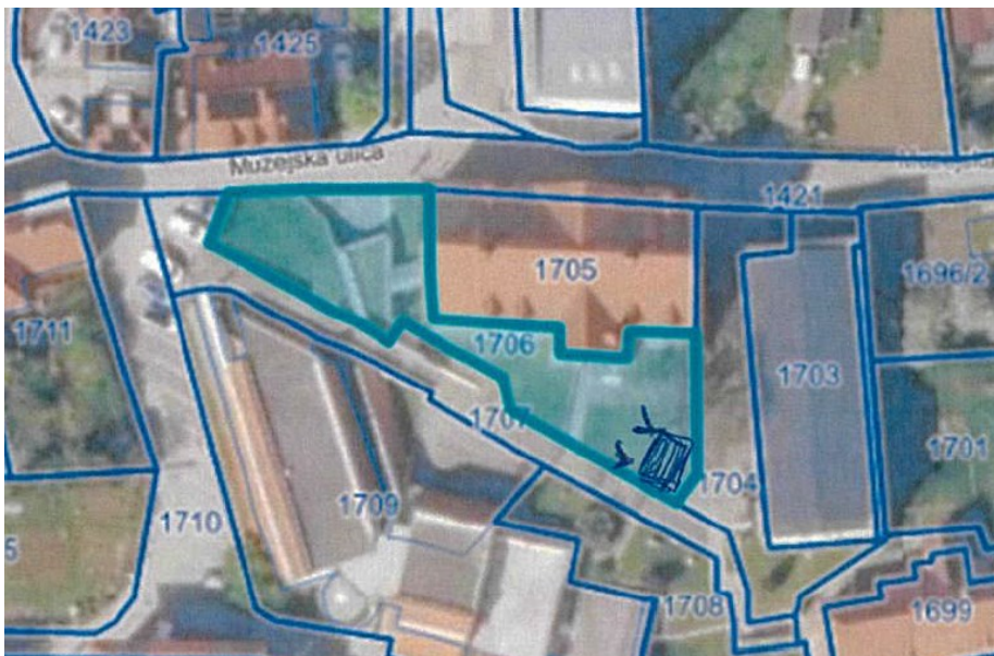
Slika 2: Shema lokacije zvočnih naprav