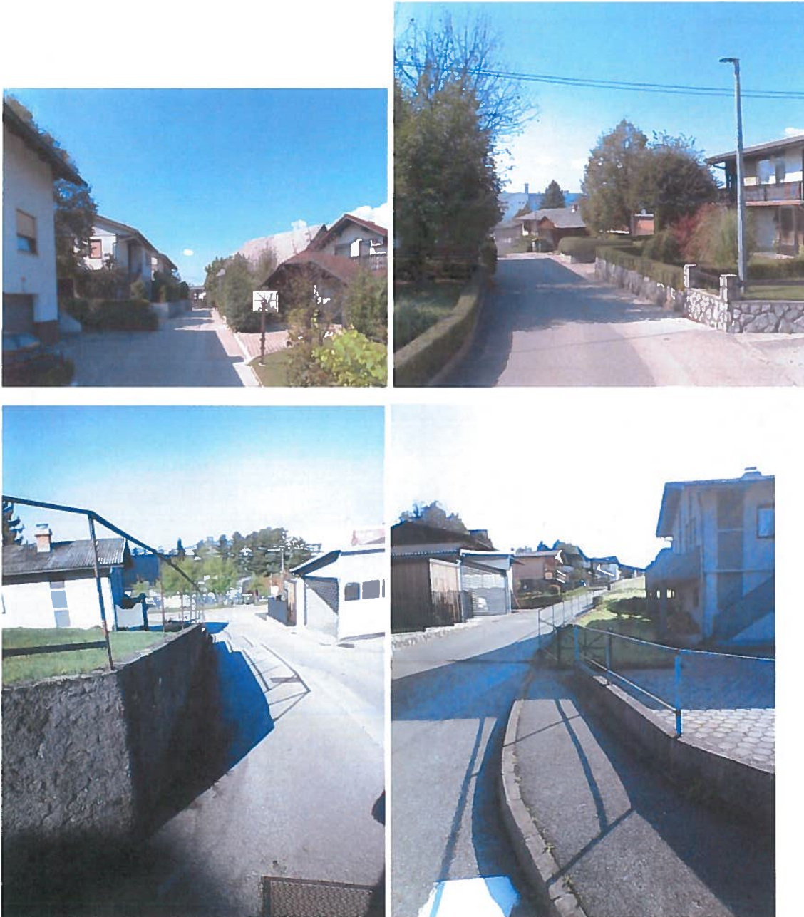
Slike 6 do 9: JP 799215, Na Lazu

Oba odseka se nahajata v območju omejene hitrosti – Cona 30, predpisana omejitev hitrosti vožnje je 30 km/h. Površin za pešce na obravnavanih odsekih ni urejenih.