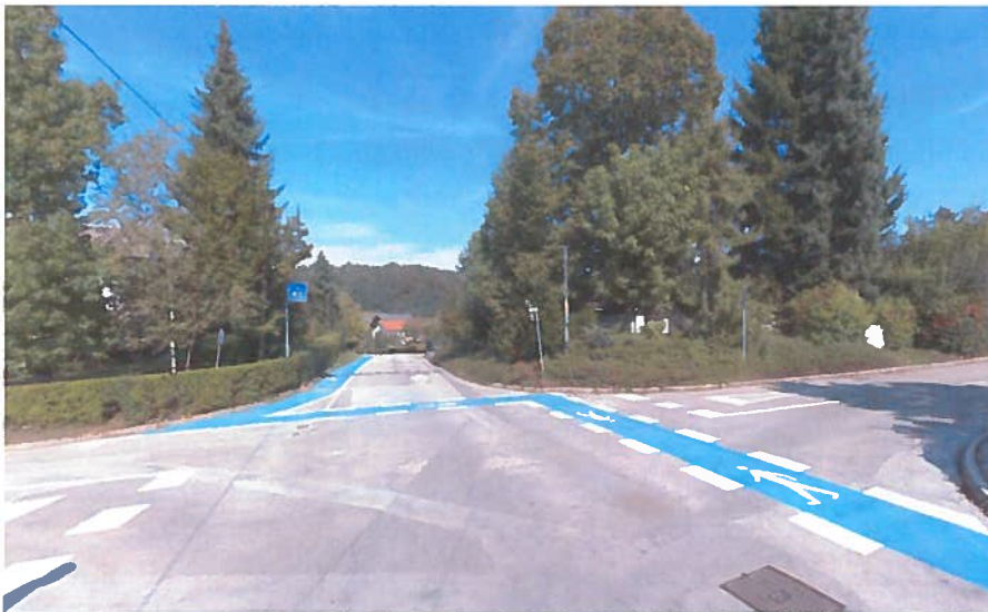
Slika 19: križišče ulic V Brezov log, Cesta Brigad in ulica Danila Bučarja, z nadaljevanjem pasu za pešce po JP 799471, Cesta Brigad