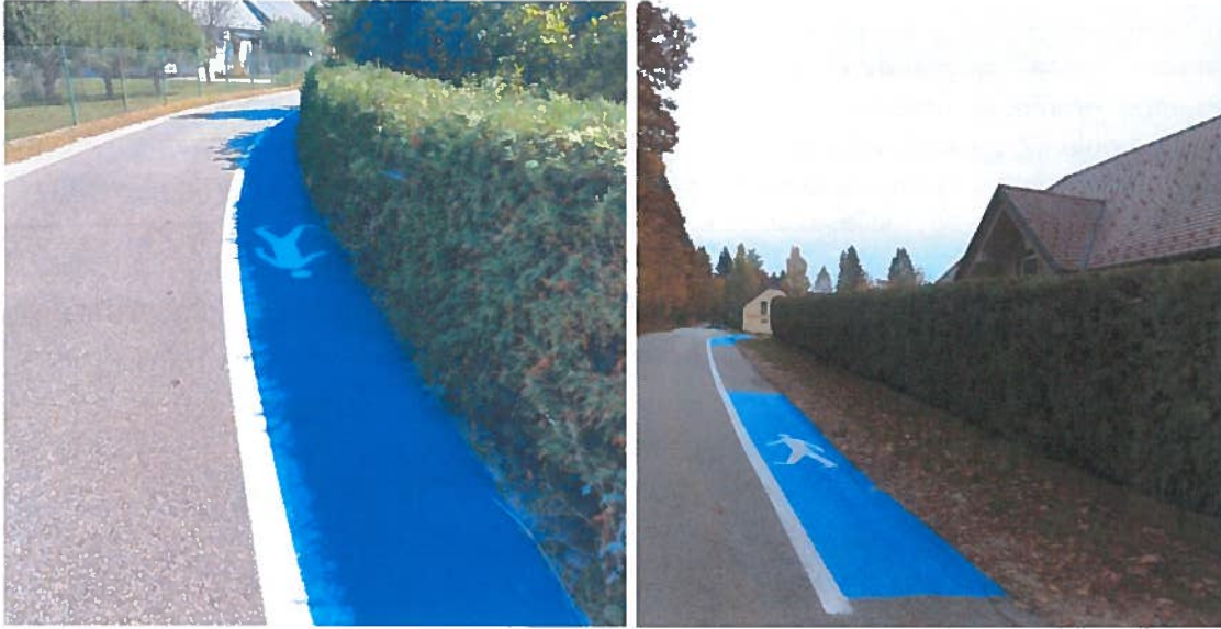
Sliki 20 in 21: Drejčetova pot in Regrča vas