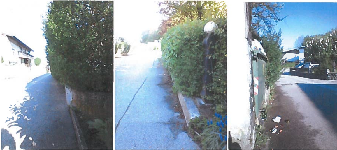
Slike 14 do 16: poseganje vegetacije v profil ceste