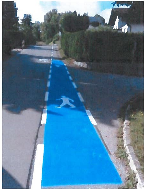
Slika 17, 18: JP 799097, Bajčeva ulica; LK 299181, ulica Marjana Kozine