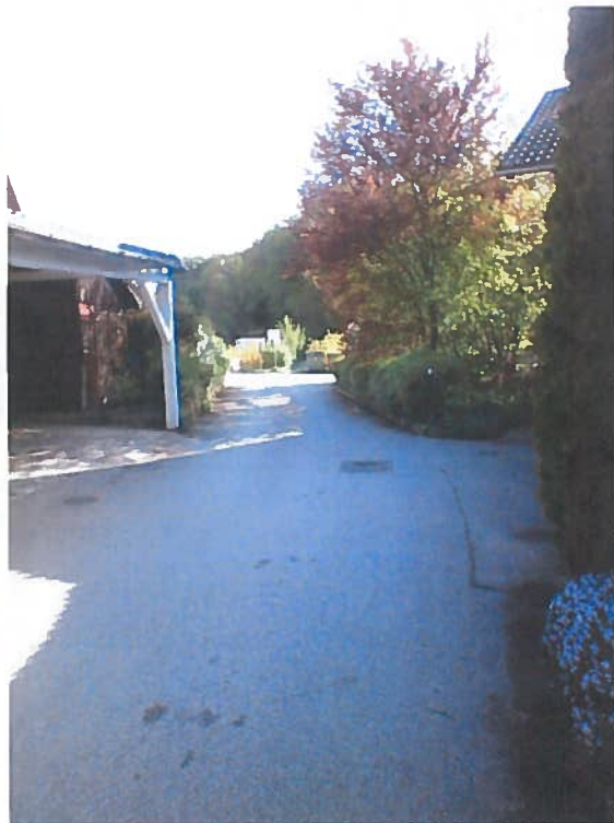
Slike 10 do 13: LK 299071, Na Lazu