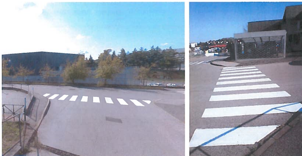
Sliki 4 in 5: območje priključka JP 799215, Na Lazu na LK 299071, Avšičeva – Na Lazu – Knafelčeva ulica v km 0,225

Začetek JP 799215, Na Lazu predstavlja priključek na odsek LK 299071, Avšičeva – Na Lazu – Knafelčeva ulica v km 0,225. V območju priključka je urejena cestna razsvetljava, površine za pešce z označenim prehodom za pešce. Iztek pločnika je pozicioniran levo, gledano v smeri stacionaže JP 799215, Na Lazu.