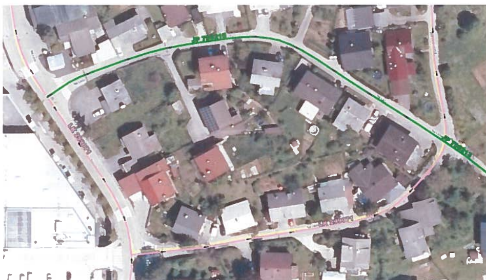
Slika 1: prikaz LK 299071, JP 799215, ulica Na Lazu

Ulico na Lazu predstavljata dva odseka kategoriziranih občinskih cesti in sicer LK 299071, Na Lazu, ki poteka od stacionaže km 1,000 do konca odseka v skupni dolžini 140 m in JP 799215, Na Lazu v celotni dolžini odseka, to je 176 m.