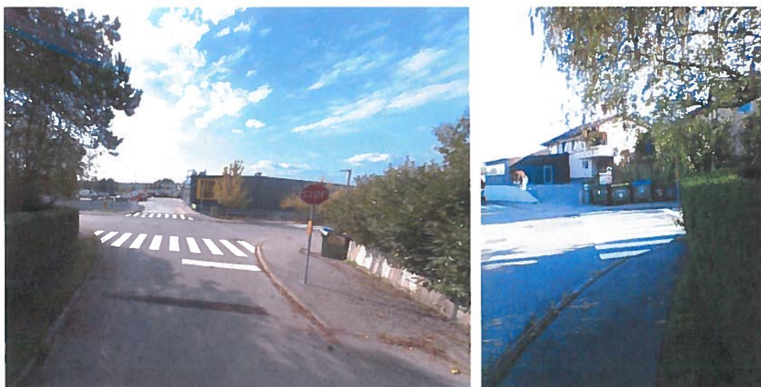
Sliki 4 in 5: območje priključka LK 299071, Na Lazu na LK 299071, Avšičeva – Na Lazu – Knafelčeva ulica v km 0,152

Konec LK 299071, Na Lazu, je na LZ 299071, Avšičeva – Na Lazu – Knafelčeva, v km 0,152. Cesta se zaključuje kot krožna pot. V območju priključka je urejena cestna razsvetljava, površine za pešce z označenim prehodom za pešce. Pločnik se navezuje na LK 299071, Na Lazu, desno, gledano v nasprotni smeri stacionaže.