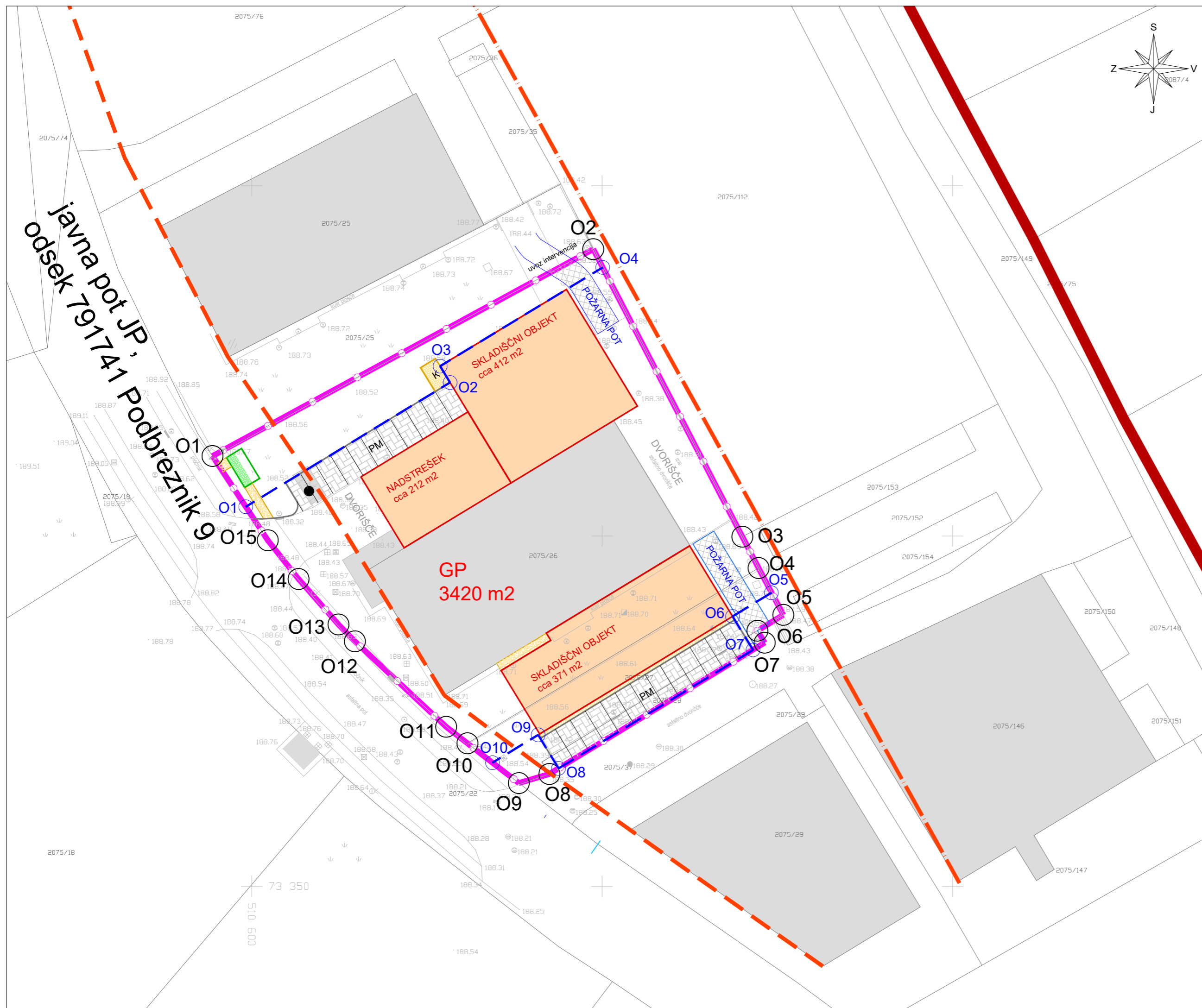
- organizacija GP T8a po veljavnem ZN