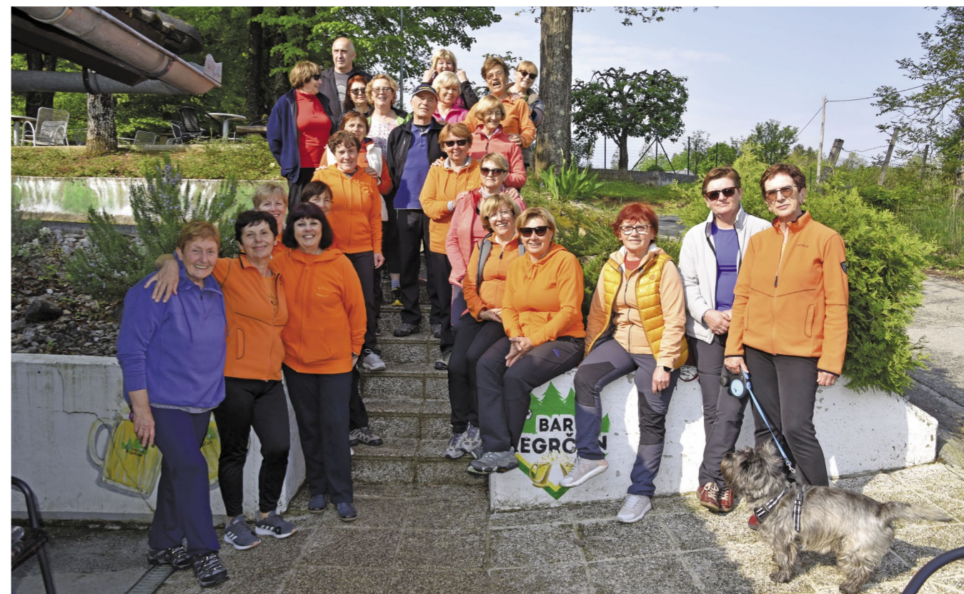
Del prve skupine iz Portovala je 6. maja zjutraj telovadil pod krošnjami igrišča v Regrči vasi in tako podprl ustanovitev zadnje, 13. skupine Pri Roku. M. M.