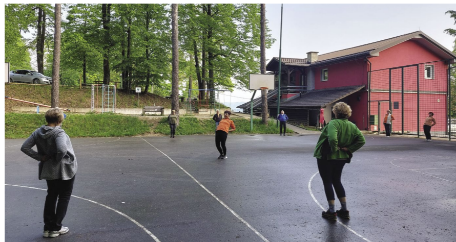
Jutranje vaje Šole zdravja izvajajo vsak delovnik, potekajo pa že na 13 lokacijah po Novem mestu, ob vsakem vremenu ali letnem času. S terena že prejemajo prošnje za nove skupine.