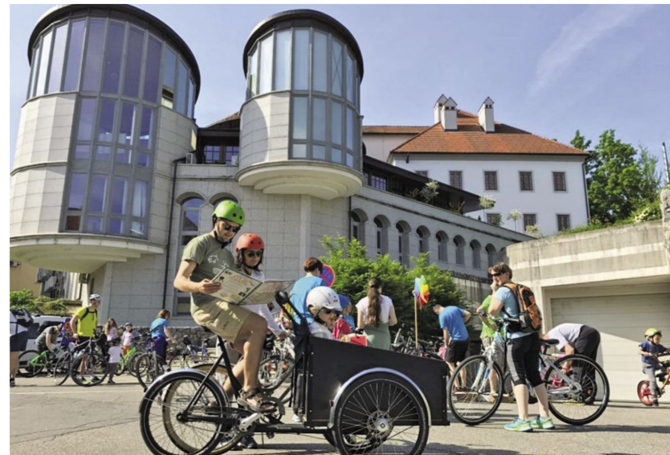
Pred pandemijo smo prvič organizirali družinsko kolesarjenje za zaposlene in uporabnike.