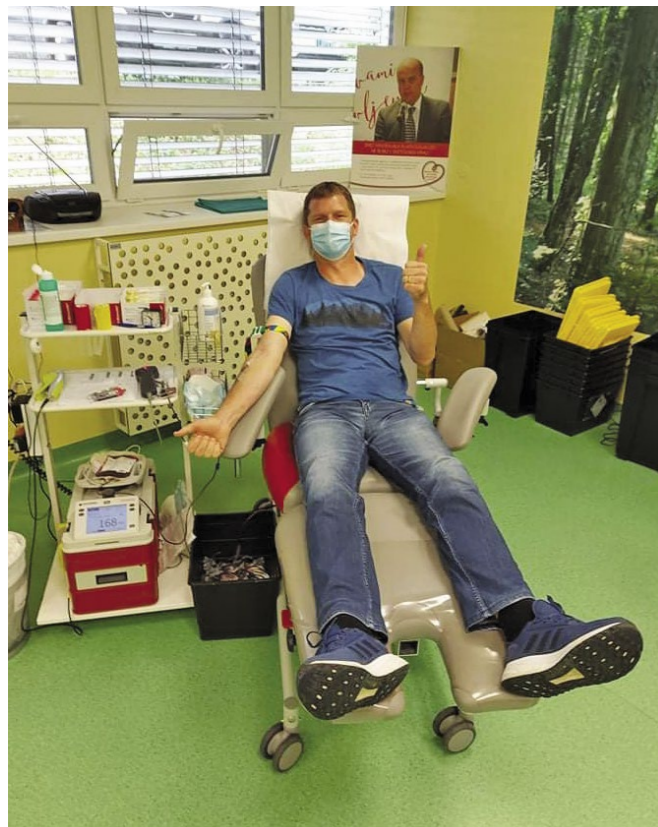
Knjižničarji se vedno radi odzovemo na skupinske krvodajalske akcije.

Na Študijskem oddelku se nahaja ZDRAVstveni KOTiček, v katerem je mogoče najti uporabne informacije s področja zdravja, občasne knjižne razstave o aktualnih tematikah, ki jih pripravljamo s pomočjo številnih partnerjev in jih dopolnjujejo tudi občasne aktivnosti in predavanja v sklopu redne prireditvene dejavnosti knjižnice. Prav tako se tam nahajajo zloženske s priporočilno literaturo v povezavi s posameznim področjem zdravja, na spletni strani pa v sklopu ZDRAVstvenega KOTička najdete tudi aktualne elektronske vire podatkov s področja zdravja.