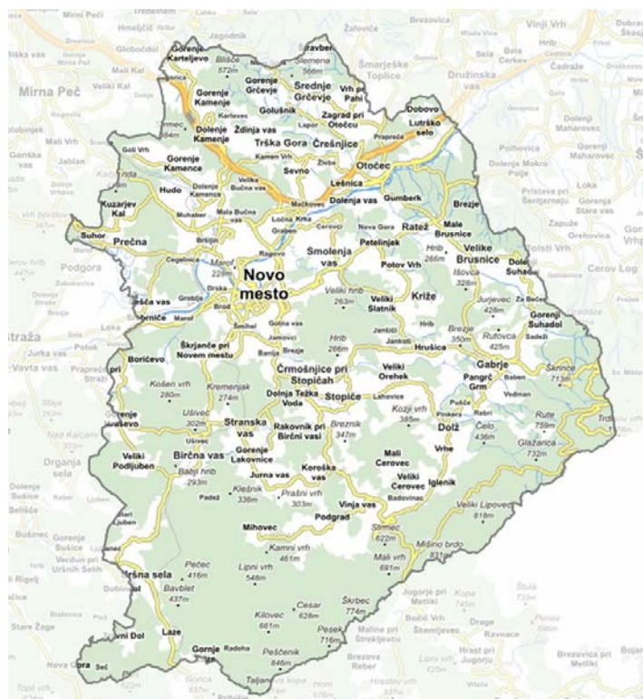
Karta št.1: Območje Mestne občine Novo mesto