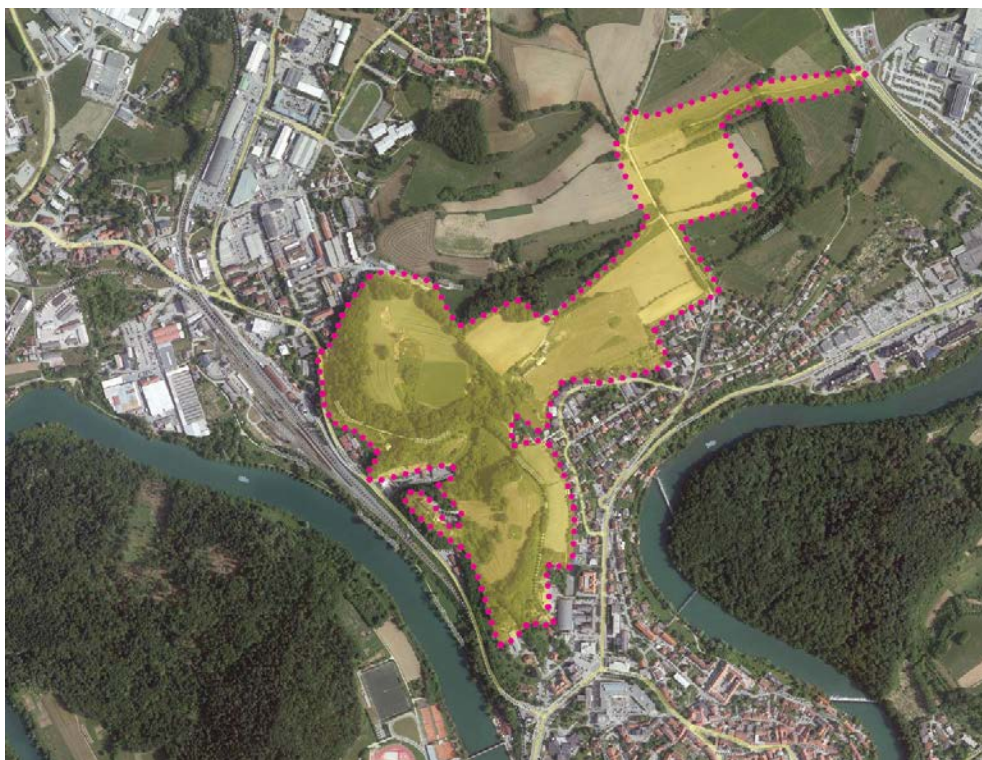
Slika: Prikaz okvirnega območja arheološkega parka na Marofu