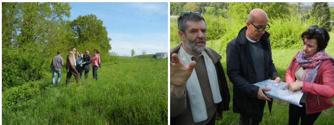
Slika: V sklopu priprave strokovnih podlag in projekta za izvedbo je bil izveden terenski ogled gradišča Marof, z namenom, da se določi trasa načrtovanih peščenih poti

gospodarske javne in druge infrastrukture za funkcioniranje območja arheološkega parka, glede na zaključke predhodno izdelanih strokovnih podlag, ureditve načrtovane krožne peščene poti na gradišču Marof, ki se navezuje na Kettejev drevored, ter ureditev drevoreda.