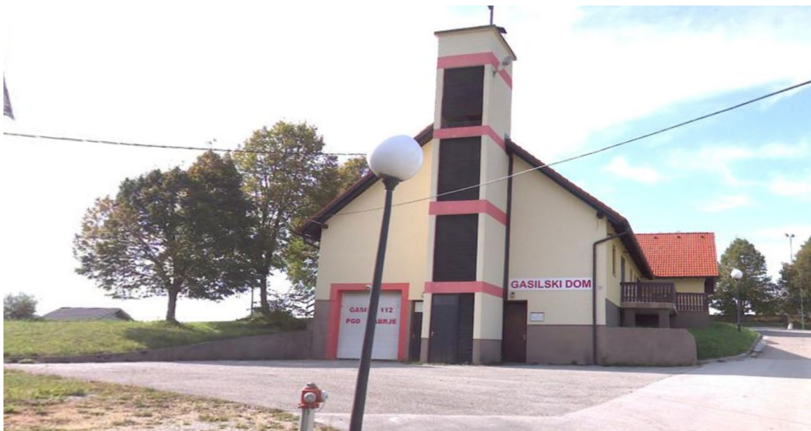
Stavba 1478 592 vzhodna fasada in pred njo gasilsko dvorišče (parc. št. 1551/2 k.o. Gabrje)