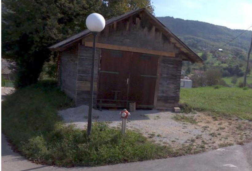
Stavba 1478 591

Ugotovljeno je bilo, da je z nepremičninami parc. št. 1551/1, 1551/2, obe k.o. 1478 Gabrje, na dan uveljavitve Zakona upravljalo izključno gasilsko društvo, ki je iz tega razloga dejanski lastnik teh nepremičnin. Gasilsko društvo je na dan uveljavitve zakona upravljalo tudi s posameznimi deli stavbe 1478 592, ki stoji na nepremičnini parc. št. 1551/3 k.o. 1478 Gabrje in je iz tega razloga dejanski lastnik teh posameznih delov, kar predstavlja solastnino do okvirno 1/3 od celote na nepremičnini parc. št. 1551/3 k.o. 1478 Gabrje (v nadaljevanju je predvidena vzpostavitev etažne lastnine).