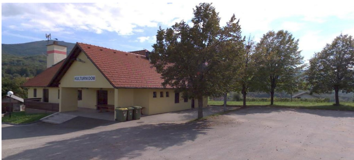
Stavba 1478 592 zahodna in severna fasada