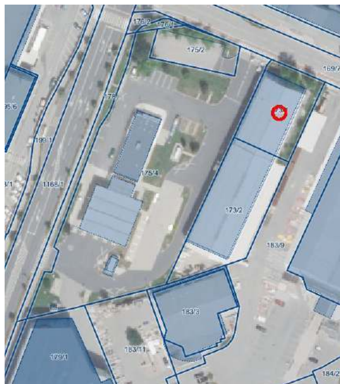
Slika 3: Petrolova upravna stavba

Glavni namen priprave SD UN je dopolnitev dejavnosti v ureditveni enoti P5 - 1. del, Območje bencinske črpalke ob Ljubljanski cesti nasproti Blagovno-trgovskega centra, v bivši Petrolovi upravni stavbi.