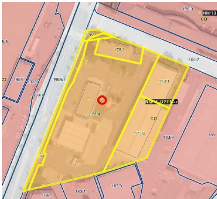
Slika 1: Območje sprememb in dopolnitev

V območje urejanja, ki je predmet sprememb in dopolnitev UN Bršljin (v nadaljevanju: SD UN) je vključena ureditvena enota P5 – 1. del, ki zajema zemljišča parc.št. 176/2, 178, 176/1, 175/2, 173/1, 173/2, 175/4, vse k.o. 1456 Novo mesto, v velikosti 8 232 m 2 .