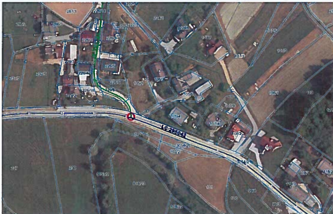
Slika 1: priključek JP 791721, Prečna – Kuzarjev Kal na LC 295042, Prečna; območje ureditve para avtobusnih postajališč in prehoda za pešce

Ureditev para avtobusnih postajališč in prehoda za pešce na občinski cesti LC 295042, v naselju Prečna, na delu od km 1,500 do km 1,635.