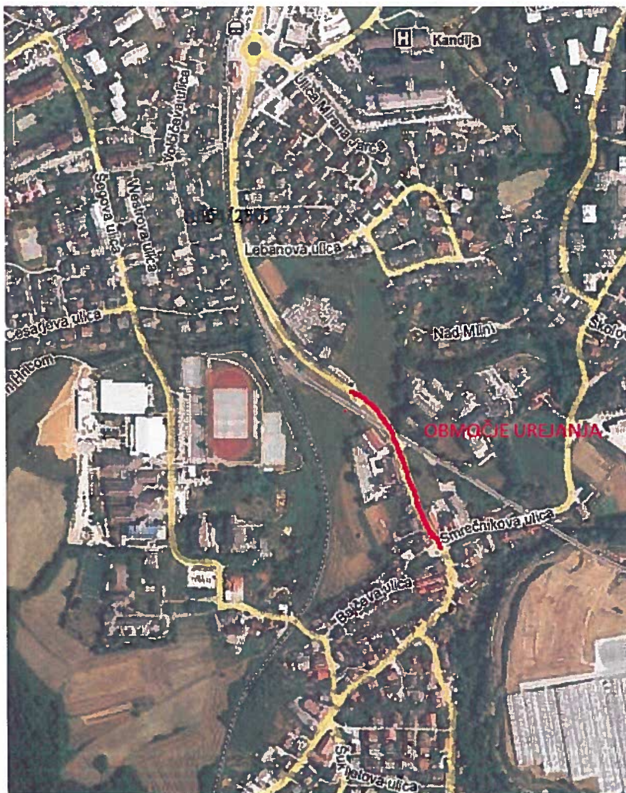
Potek območja urejanja na regionalni cesti R3-664/2501 Gaber-Uršna sela-Novo mesto ob Šmihelski cesti od križišča s Smrečnikovo ulico do pokopališča v Šmihelu