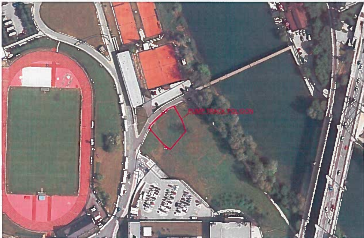
Slika 1: Prikaz okvirnega območja lokacije poligona

Mestna občina Novo mesto želi v urbanem okolju Novega mesta umestiti pump track poligon (grbinasti poligon) v asfaltni izvedbi. Lokacija poligona je umeščena ob rob športno rekreacijskega parka Portoval, na zelenico ob reki Krki, kjer se križajo peš in kolesarske poti ob reki Krki v neposredni bližini centra Novega mesta.